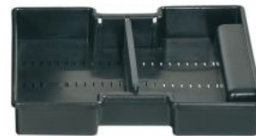
KIT TRAY MUB